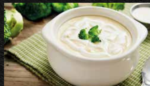
Sopa de brócoli (10 oz)