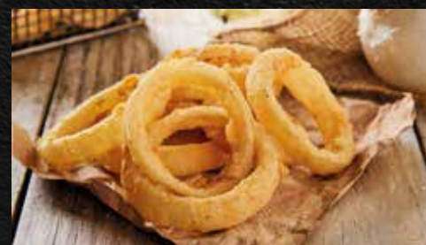
Aros de cebolla