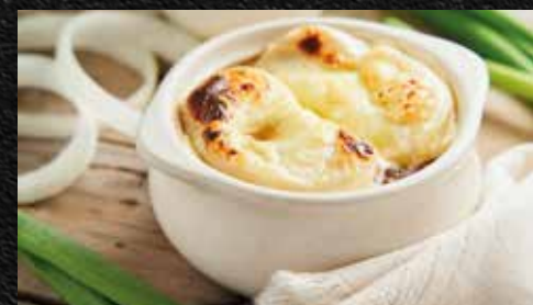
Sopa de cebolla (10 oz)