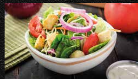
Ensalada de la casa